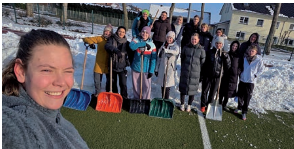
Im Trainingslager in Lastrup musste der Kunstrasen per Hand befreit werden