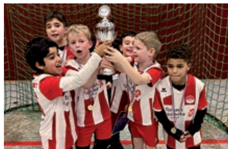
Die U9-Junioren feiern den Turniersieg.

Am Ende setzte sich also der VfL Eintracht Hannover durch und sicherte sich mit konstant starken Leistungen