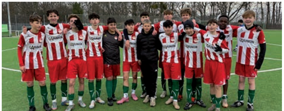
Die B2 hat eine tolle Entwicklung genommen.