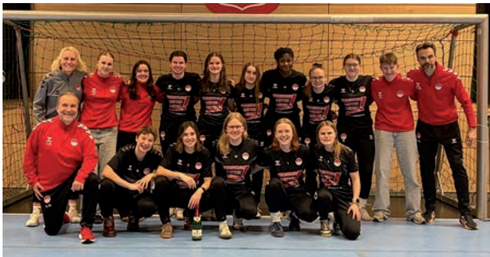
Die 1. Frauen - hier beim NP Hallen Masters - freut sich auf die Rückrunde in der Landesliga.

Ergänzend dazu absolvierten wir regelmäßig Athletikeinheiten mit Fokus auf Kraft, Stabilität, Schnelligkeit und Prävention. Ziel war es, die körperlichen Voraussetzungen für die Rückrunde zu optimieren und gleichzeitig Verletzungen vorzubeugen. Die Mannschaft hat diese Phase mit hoher Trainingsdisziplin und