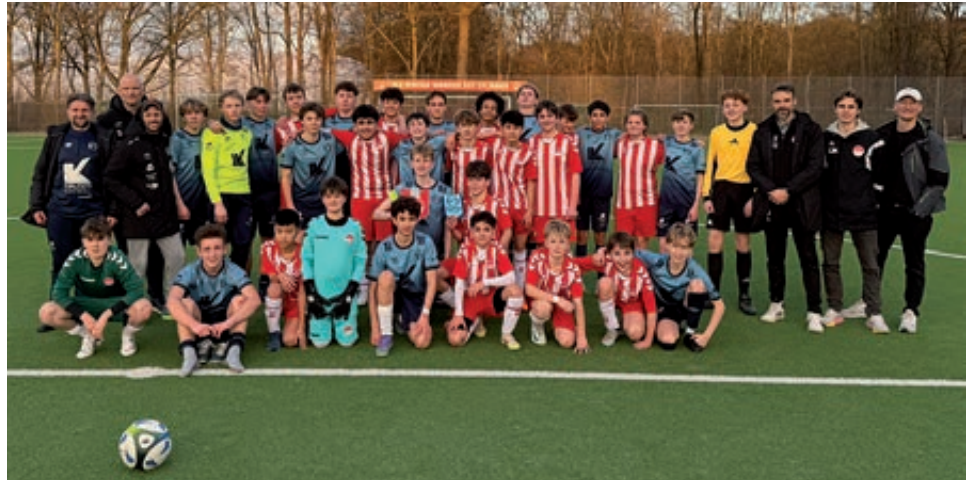
Die C2 und die Gäste aus Oygarden trennten sich im Testspiel 3:3.

konnten. Alles in allem war das erste Testspiel des Jahres auf Kunstrasen ein guter Auftakt zur anstehenden Rückrunde. Auch die C1 und die C3 sind gegen die norwegischen Kicker angetreten, beide unterlagen den Gästen mit 3:5 beziehungsweise 1:2.