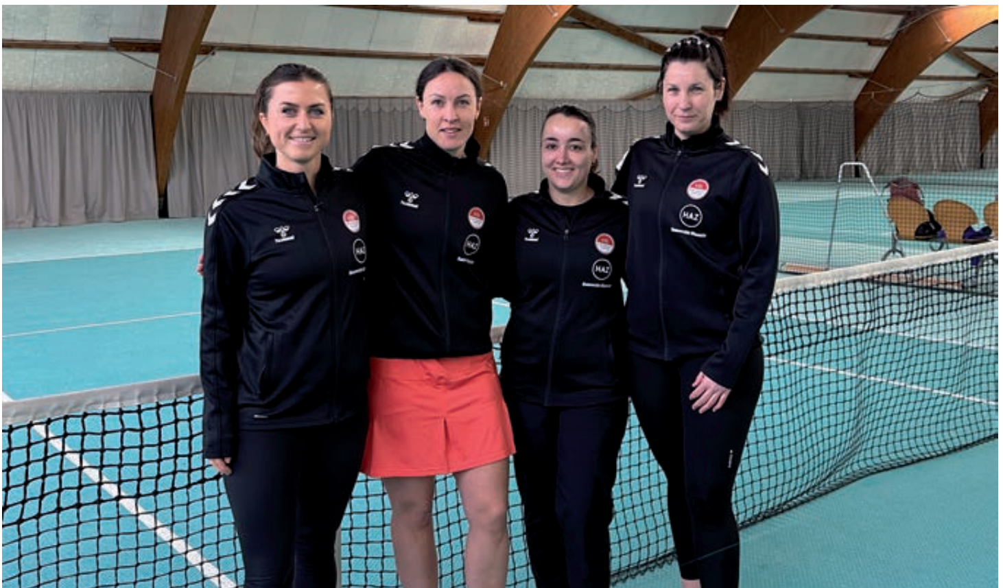
Im Sommer und im Winter aufgestiegen: die Damen 30 des VfL Eintracht.