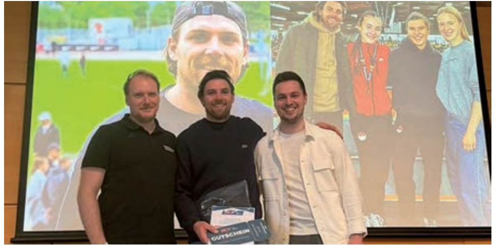
Leistungen, die eindrucksvoll die Quali-

Diese Ehrung ist nicht nur eine persönliche Auszeichnung, sondern ein riesiger Meilenstein für unseren Verein und ein eindrucksvoller Beweis für die Nachwuchsarbeit, die bei uns tagtäglich geleistet wird.